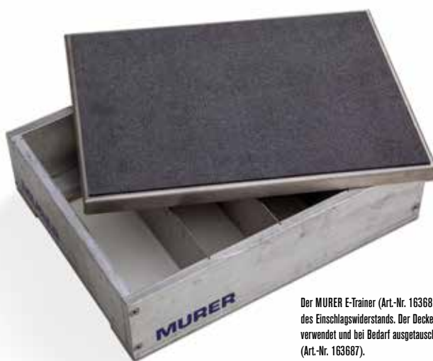
Der MURER E-Trainer (Art.-Nr. 163685) zur Simulation des Einschlagswiderstands. Der Deckel kann mehrfach verwendet und bei Bedarf ausgetauscht werden (Art.-Nr. 163687).